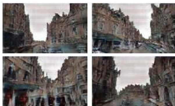
図 1 関連研究において生成された街並み画像

関連研究 (2) では、学習モデルに DCGAN (Deep Convolutional GAN) を用いることで、解像度やリアリティに課題はあるものの、実際の街並みと近似な印象を被験者に抱かせる街並み画像の生成が可能となっている (図 1)。しかし DCGAN は生成される画像がすべて学習データと AI 次第になってしまい、第三者が意図したような建物のデザインを生成することは困難である。それに対し、本研究では Pix2Pix を用いることにより、条件となるラベル画像を入力させることで、それを基にした建物の画像を生成することが可能である。これにより、利用者が意図したような建物のデザインを生成することも可能である。