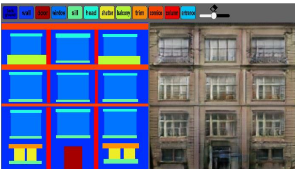
図3 ラフ画の描画で詳細な画像が出力される画面

システム使用の流れとしては、画面左側にパレットにある色で四角形を描画し、そのラフ画を、学習させたPix2Pixのモデルを通すことにより、画面右側に描画されたラフ画を基にした詳細な画像をリアルタイムで出力するというシステムである(図3)。