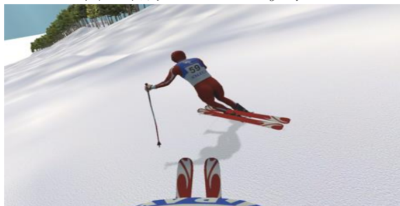
図2 衝突しそうな状況