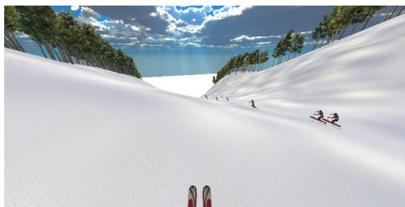
図1 自身のアバターの視野