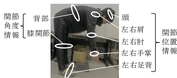
図 2 算出した位置・関節角度情報の部位