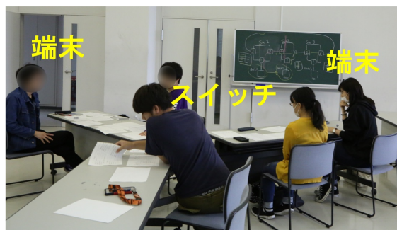
図 5 演習風景