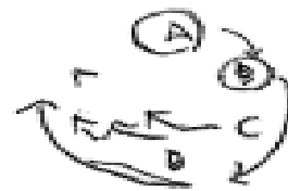
図3 学習者解答用紙抜粋II