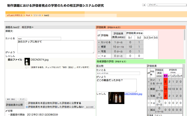
図 3, 相互評価+ (評価結果の閲覧). 左側: 課題提出, 右側上段 自身の提出分に対する他学習者による評価結果, 右側下段 自身が取り組んだ評価に対する教員や他学習者の評価結果と比較)

本システムの相互評価+部は2013年4月に完成し、試験を開始している。現時点で、2013年度前期のWebデザイン(Flash)で利用、その後、2013年後期のWebデザイン基礎(HTML,CSS)にて利用を予定している。