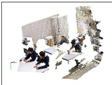
図3 三次元点群に基づく提示の例

そこで本研究では、受講者に対応する点群のみを可視化するために、まず、予めセンサー座標系と机座標系との間の対応関係を求めておき、求められた三次元点群の全てを一旦机座標系に変換する。同時に、机座標系における机や椅子の位置を計測しておくことで、机が配置された領域かつ、机の天板より上の領域に存在する点群を受講者に対応する点群として獲得することができる。図4に、受講者部分のみを切り出し、各受講者の前の机の縁に垂直な平面を同時に提示した例を示す。机の縁を基準として、前のめりになっているか、あるいは、そうでないかの判断が容易になるのではないかと考えられる。