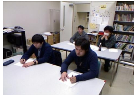
図 1 模擬授業のシーンの例

そこで本稿では、受講者の様子を、深度センサーを用いて獲得し、提示する枠組みについて検討する。深度センサーとしては、マイクロソフト社の Kinect センサーを用いる。このセンサーは、本来はゲーム機の入力デバイスとして人間のジェスチャを検出するために開発されたものであり、赤外線パターンを対象に照射しつつ赤外線カメラで観測し、照射したパターンとのずれを計測することで対象までの深度を検出する。このセンサーの水平視野角は約 58 度、垂直視野角は約 45 度で、深度情報を深度マップとして奥行約 4 メートルまで獲得でき、映像も同時に獲得できる。模擬授業における受講者のシーンの例を図 1 に示す。また、同時に獲得される深度マップの例を図 2 に示す。図 2 では、画像の明度で深度を表現し、明るいほど被写体が近いことを示している。