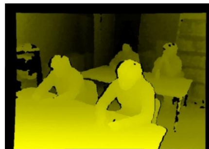
図 2 模擬授業の深度マップの例