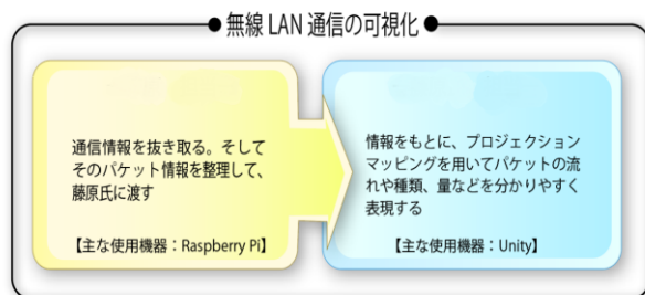
図 1 システム概要図

我々は、無線 LAN ルータが通過したパケットをキャプチャし、その情報をもとにプロジェクションマッピングを行うことにより、無線 LAN 通信を可視化する教材を開発した。無線 LAN ルータには Raspberry Pi (3) を、プロジェクションマッピングを行うソフトウェアに Unity (4) を用いた。無線 LAN ルータである Raspberry Pi がキャプチャしたパケット情報をもとに、Unity を用いてプロジェクションマッピングを行った。システムの概要を図 1 に示す。