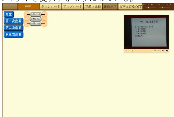
図1：キットの逐次提供を行っている画面

学習者は画面のダウンロードボタンから教材を選択しキットのダウンロードを行う。本システムでは映像とキットの対応付けを行い、図1の画面のように視聴中に対応する映像区間に達した際に、その命題のキットを提供するようにしている。