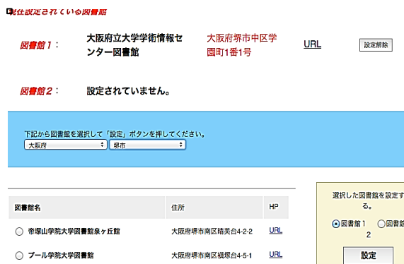
図2 図書館設定画面

図2に設定画面を示す。自身が希望する都道府県と市町村を選択することで、設定地域に存在する図書館が表示され、「図書館名」、「住所」、「ホームページ」を確認できる。任意の図書館を設定することで、ユーザの利用図書館として登録できる。なお、一度登録しておけば、同じPC環境である限り再設定する必要はない。