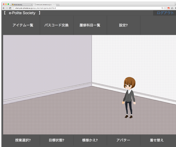
図2 学習者の画面 (ゲーム画面)