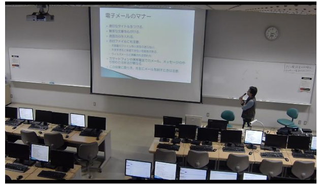
図1 収録された授業ビデオ

以上、2016年3月に東北大学が導入した、ネットワークカメラを利用して学部1、2年次生向けの全学教育科目の全ての授業を自動収録・配信可能とする機能を備えたLMSとしてのISTUシステムについて紹介した。今後、2016年10月からの本運用開始に向けた詳細を調整するとともに、その後の実運用におけるシステムの運用状況や利用者の印象、授業運