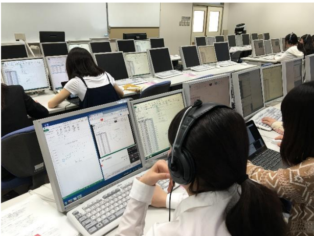
図 2 授業における動画視聴の様子

対象とした演習科目は 2 クラスあり、それぞれの受講者数はともに 13 名であった。授業時に全受講者が同時に動画教材にアクセスすることになるが、視聴における遅延等は全くみられなかった。当初解説音声について録音時の音量レベルが低く、聞きづらいという指摘があり、翌週分よりレベル変更を行った。