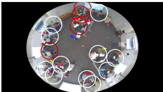
図 3.活動立ち上がりの可視化. 白円は各グループ. 赤円は活動立ち上がりを検出したグループ.

始まった, 1人が席を立ち話し合いが止まった, メンバー全員がノートに何かを書き始めたといった活動が見られた箇所は勾配が急であった. これらはそれぞれグループワークにおける議論と個人作業の契機であるといえる. つまり, このフレーム間差分の増加量に着目することでグループ内の活動の契機を検知することができると考えられる. このフレーム間差分量の増加量は活動立ち上がりを示しうるもの