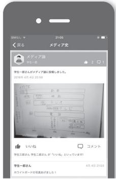
ファイル表示 (教員・学生)