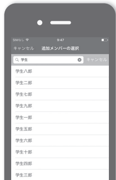
メンバー追加 (教員・学生)