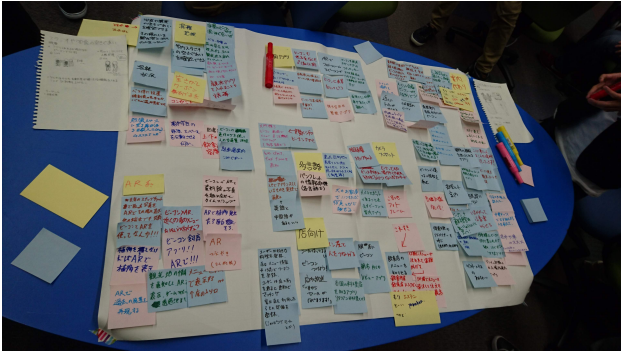
図 1: アイデア考案中の模造紙