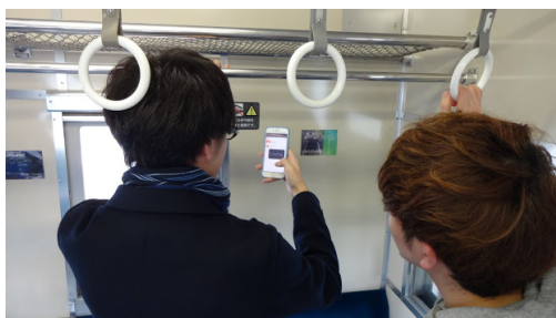
図 4: いさりび Graffiti のユーザビリティテスト

前者のグループは、西部地区、五稜郭タワー、函館朝市において、お土産を探して交換するというストーリーに沿ってアプリケーションを利用し、後者のグループは列車内に写真や思い出を残す(図4)という行動を通して、各実装サービスのユーザビリティを評価した。