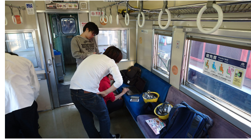
図 3: 道南いさりび鉄道車両での検証

連携企業の協力によって、iBeacon 規格の BLE ビーコン機器約 50 個が、函館空港や函館朝市、金森レンガ倉庫、五稜郭タワーなど函館市内主要箇所を設置済み